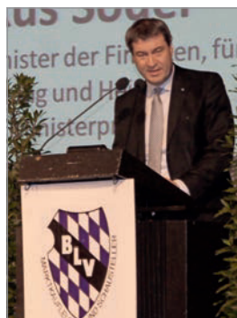
Staatsminister Dr. Markus Söder.